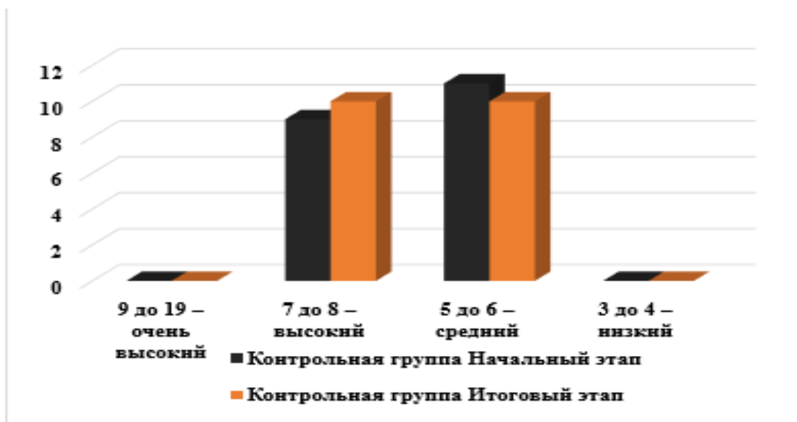
Рисунок 2. Результаты мониторинга уровня мотивации к занятиям обучающихся контрольной группы, баллы / учащихся

Далее представим результаты мониторинга уровня мотивации к занятиям физической культурой, проведенного нами среди обучающихся контрольной группы - рис. 2.